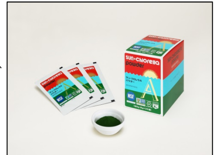
サン・クロレラAパウダー

サン・クロレラ サイクリングチーム「SUN・CHROSS」は、今後様々なエンターテインメントを発信していきます。