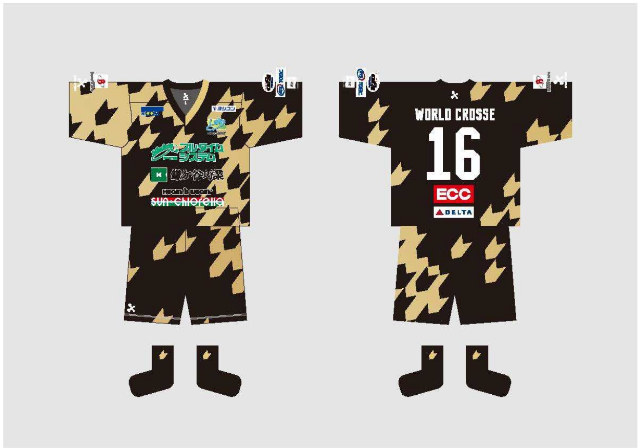
男子ユニフォーム